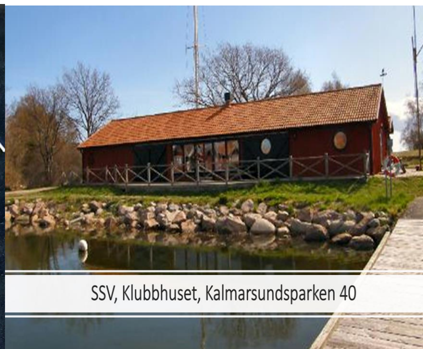
SSV, Klubbhuset, Kalmarsundsparken 40